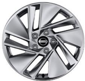
Acenta 17" kevytmetallivanteet(215/65 R17)