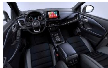
Tekna, vaihtoehto 1 Sinimustat kangas- ja keidonahkapenkit