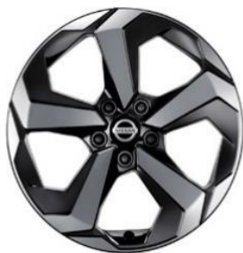
Acenta e-POWER, N-Connecta & Tekna 18" timanttileikatut kevytmetallivanteet (235/55 R18)