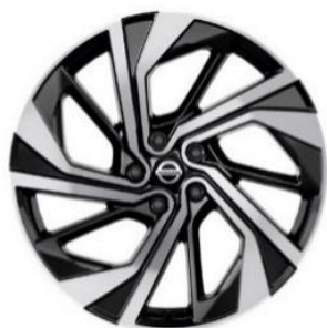
Lisävaruste Tekna+ 20" kevytmetallivanteet(235/45 R20)