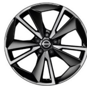
Tekna+ 19" kevytmetallivanteet(235/50 R19)