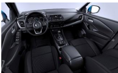
Acenta Mustat kangaspenkit