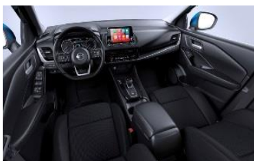
N-Connecta Harmaat kangaspenkit