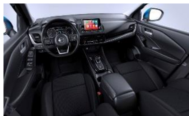
N-Connecta Harmaat kangaspenkit