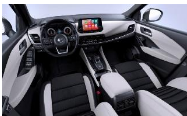
Tekna, vaihtoehto 2 Vaaleanharmaat kangas- ja keinonahkapenkit