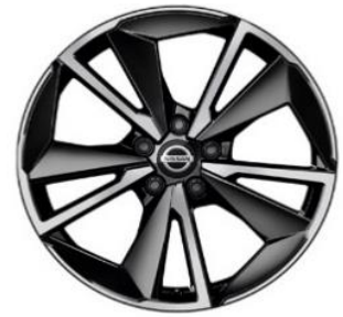
Tekna+Lisävaruste N-Connecta & Tekna 19" kevytmetallivanteet(235/50 R19)