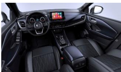
Tekna+ Sinimustat premiumnahkapenkit, päätuki keinonahkaa