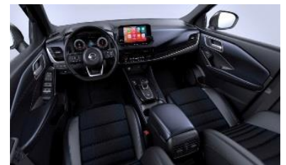
Tekna, vaihtoehto 1 Sinimustat kangas- ja keinonahkapenkit