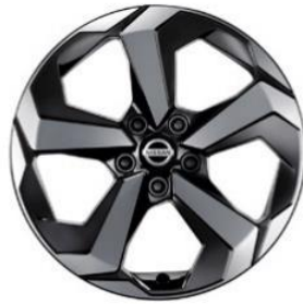
Acenta e-POWER, N-Connecta & Tekna 18" timanttileikatut kevytmetallivanteet