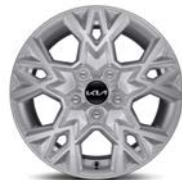
16" kevytmetallivanne Bensiini, Diesel