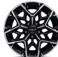
17" kevytmetallivanne GT-Line