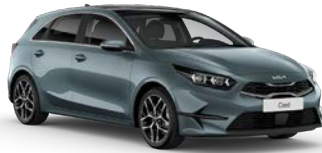
Yuka Steel Gray (USG) (metalliväri)