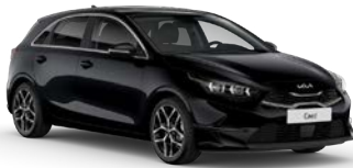
Black Pearl (1K) (metalliväri)