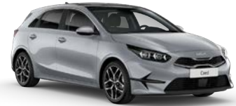
Sparkling Silver (KCS) (metalliväri)