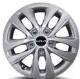
15" teräsvanne Bensiini, Diesel