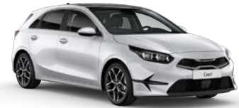
Deluxe White (HW2) (metalliväri)