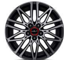
18" kevytmetallivanne GT