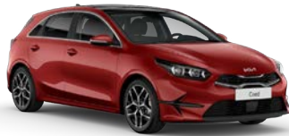
Infra Red (AA9) (metalliväri)