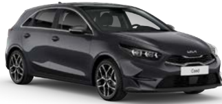
Penta Metal (H8G) (metalliväri)