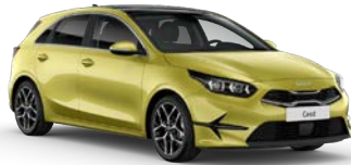
Splash Lemon (G2Y) (metalliväri)