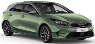
Experience Green (EXG) (metalliväri)