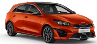
Orange Fusion (RNG) (metalliväri, vain GT-Line ja GT)