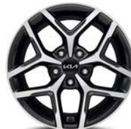
17" kevytmetallivanne Bensiini, Diesel