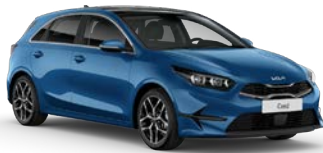
Blue Flame (B3L) (metalliväri)