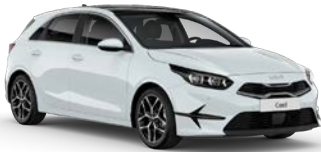
Cassa White (WD) (perusväri)