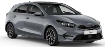
Lunar Silver (CSS) (metalliväri)