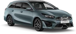
Yuka Steel Gray (USG) (metalliväri)