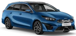
Blue Flame (B3L) (metalliväri)