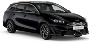
Black Pearl (1K) (metalliväri)