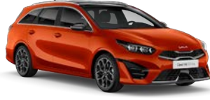
Orange Fusion (RNG) (metalliväri, vain GT-Line)