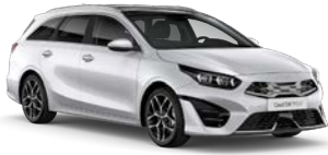
Deluxe White (HW2) (metalliväri)