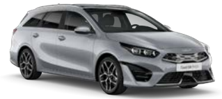
Sparkling Silver (KCS) (metalliväri, ei Plug-in Hybrid)