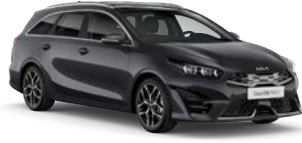
Dark Penta Metal (H8G) (metalliväri)