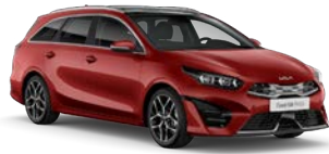
Infra Red (AA9) (metalliväri)