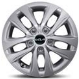
15" teräsvalve Bensiini, Diesel