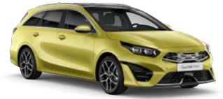
Splash Lemon (G2Y) (metalliväri)