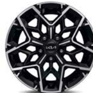
17" kevytmetallivanne GT-Line