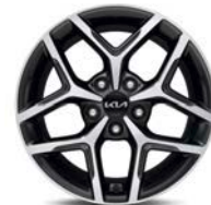
17" kevytmetallivanne Plug-in Hybrid