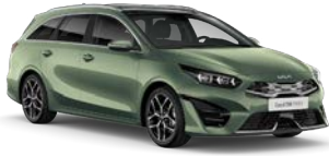
Experience Green (EXG) (metalliväri)