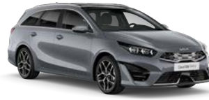
Lunar Silver (CSS) (metalliväri)