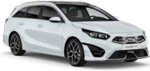
Cassa White (WD) (perusväri)