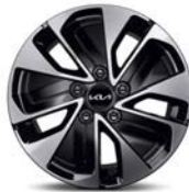
16" kevytmetallivanne Plug-in Hybrid