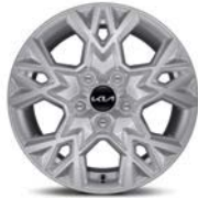
16" kevytmetallivanne Bensiini, Diesel